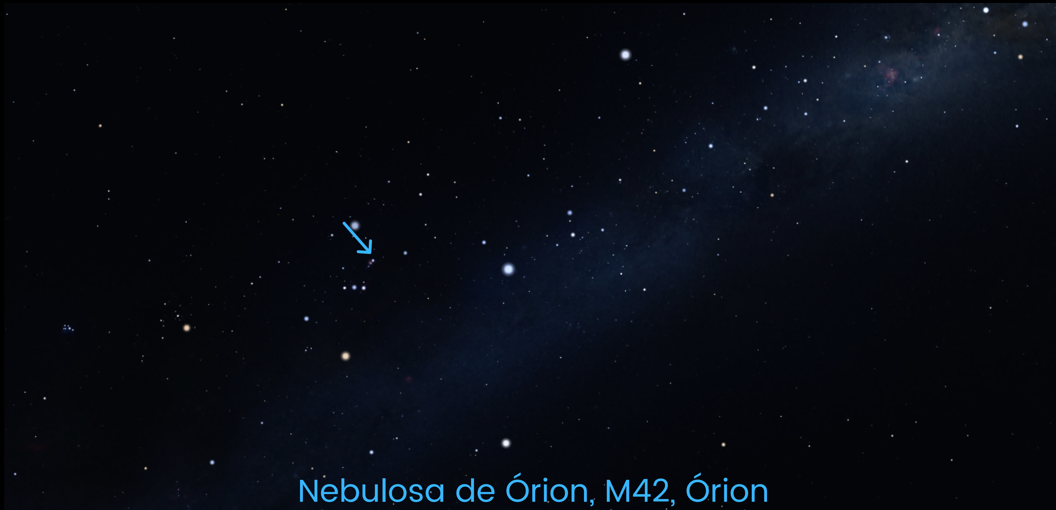
Nebulosa de Órion, M42, Órion (Também é válido Nebula de Mairan, M43, Órion)