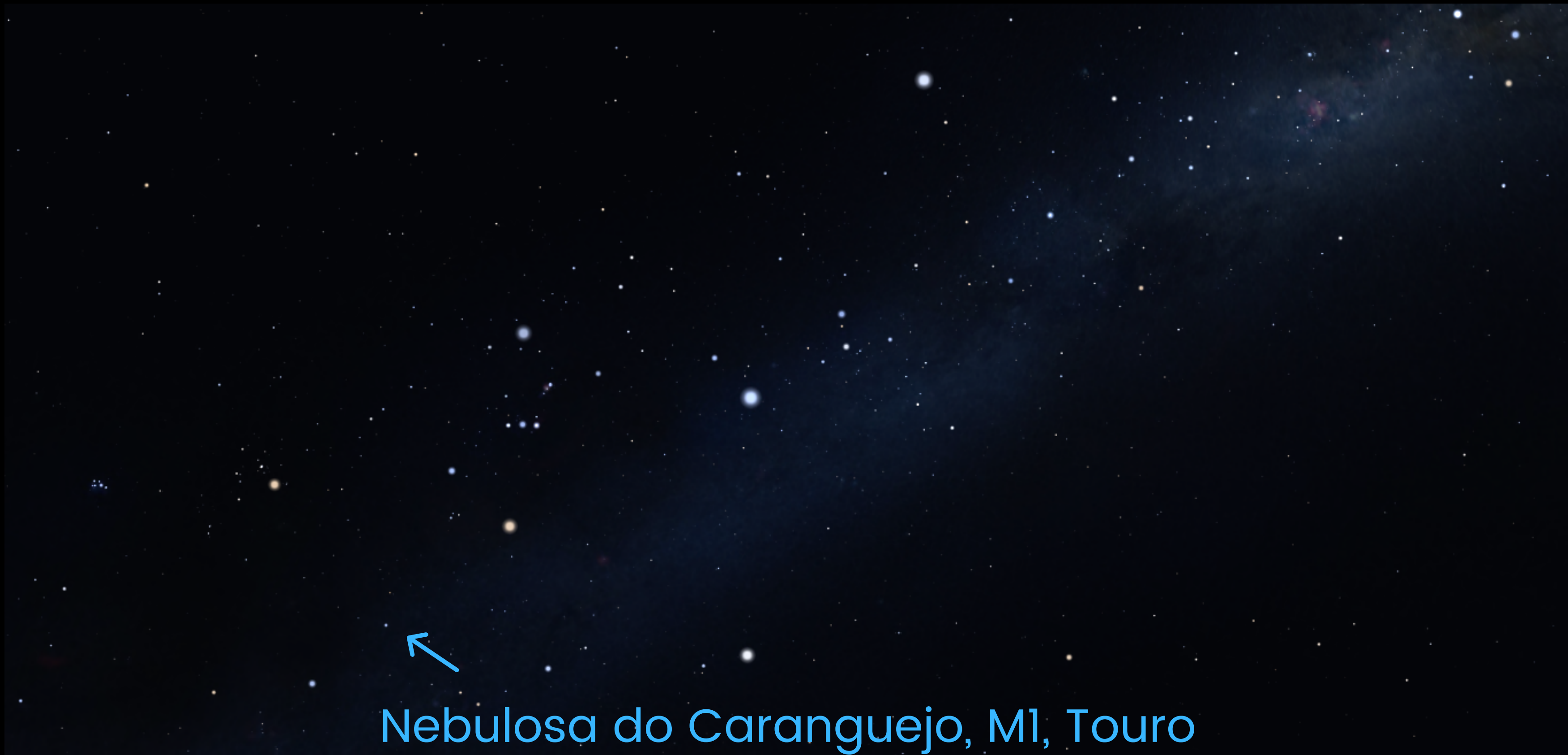
Nebulosa do Caranguejejo, M1, Touro