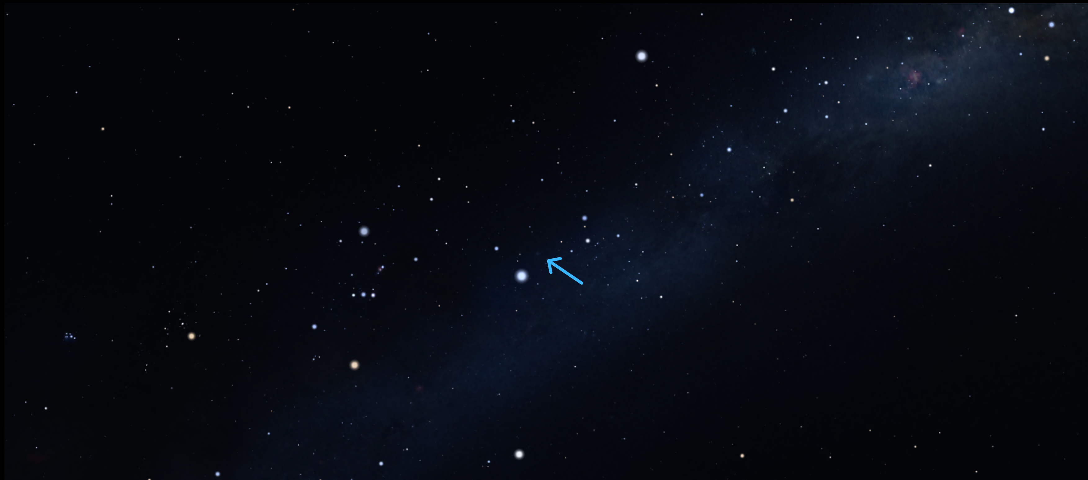
Aglomerado do Presépio ou Colmeia, M41, Cão Maior